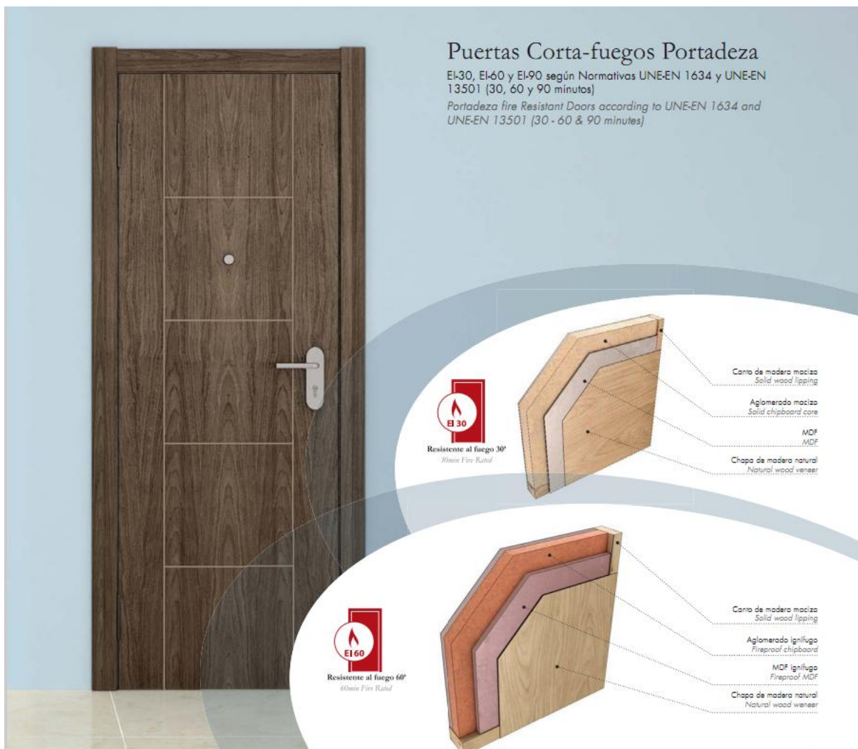
Referencias: Esquema de soluciones EI30, EI60 de Portadeza.