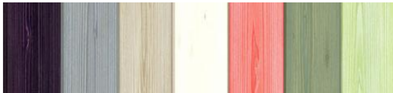
morado horizon gris bruma marrón senda blanco nevisca rojo orto verde valle verde rivera

El tintado al agua respeta la naturalidad de la madera y el medio ambiente y ofrece una amplia gama de posibilidades decorativas: desde las combinaciones con espacios pintados o empapelados e integrándose a la perfección con otros materiales como cristal, piedra, cerámica o aluminio.